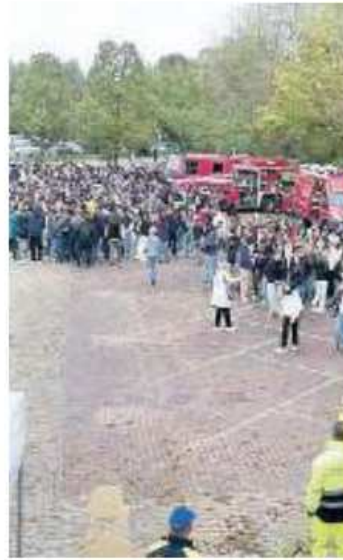
MIRANO Nella foto una fase dell'esercitazione