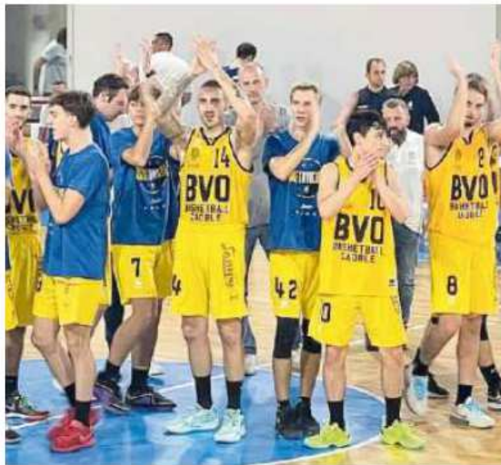
I cestisti del BVO Caorle salutano i tifosi dopo una vittoria

Serie C. La capolista Lampo Caorle, miglior attacco del girone, fa visita domani alla Villafrut Cestistica Verona (palasport Le Grazie, ore 18), puntando alla quinta vittoria consecutiva. Doppio derby in questo turno: questa sera Vectorix Mirano-Studio B&M Martellago (palestra Azzolini, ore 21), domani New Basket San Donà-Grifas Leoncino Mestre (palasport Barbazza, ore 18). Questa sera i Nudi&Crudi Salzano ospitano la Vigor Conegliano (PalaPm, ore 18.30), domani il Secis Je-